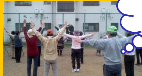
あんしん調査で見つけた屋外の場所にて