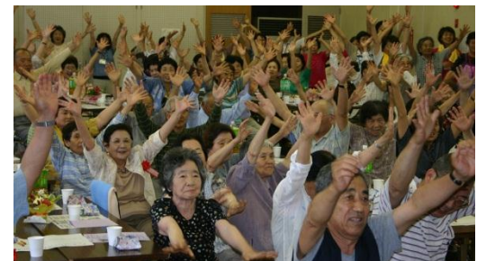
申込不要で気軽に参加可能