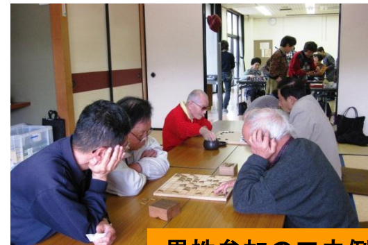
男性参加の工夫例