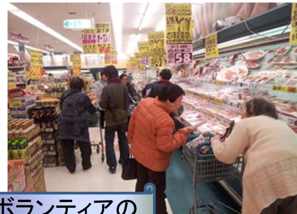
ボランティアの 買い物支援