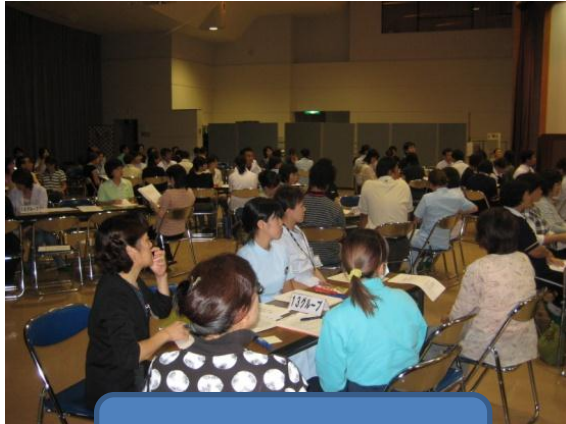
多職種連携研修会